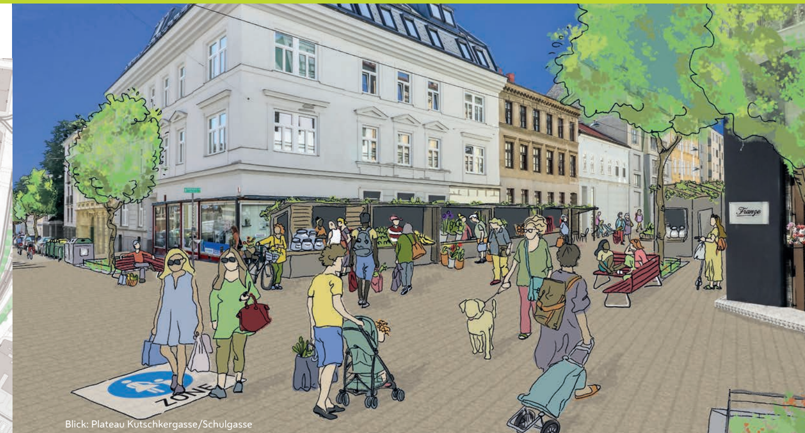
Blick: Plateau Kutschker-gasse/Schulgasse

■ Fixer Markt ■ Bauernmarkt ● Baum ■ Pflanzbeet